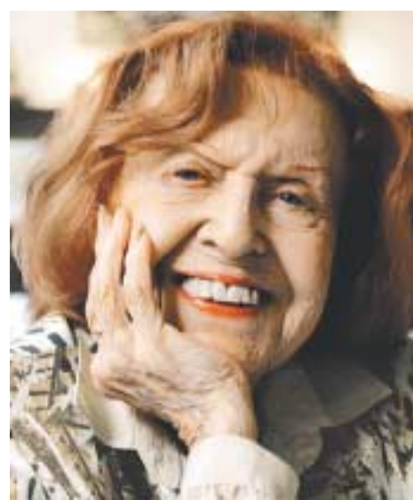
Brigitte Mira (1910 – 2005)

Hinter diesem bunten Vorhang der Brigitte Mira gab es auch das Verwundete, Abgründige, die Angst vor dem Absturz. Und niemand hat dies für die Volksschauspielerin so sehr verkörpert wie Rainer Werner Fassbinder. „Er war unerhört gut, glaubte an mich und fand mich toll“, sagte sie schwärmerisch, „wenn er heute noch leben würde,